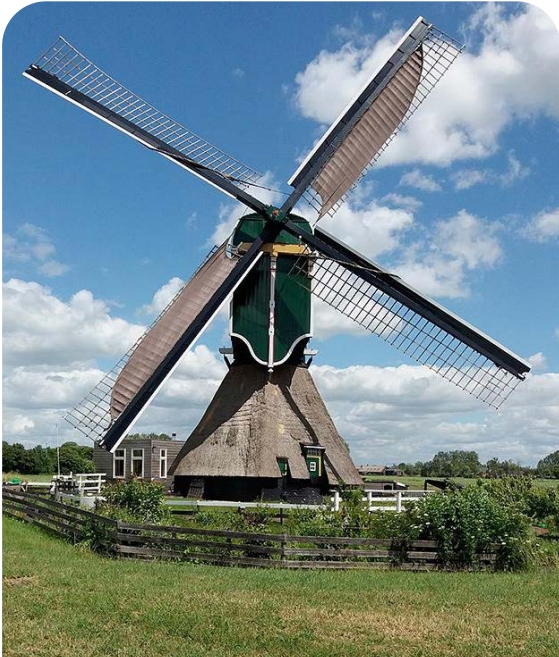
Dit is de Weijpoortsemolen in Nieuwerbrug. Het is een poldermolen.

Veel zijn er afgebroken. In Bodegraven-Reeuwijk waren er ook nogal wat molens. Daarvan zijn er nog maar een paar over.