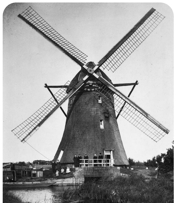
Dit was de Dammolen in Bodegraven, deze bestaat niet meer. Het was een poldermolen.