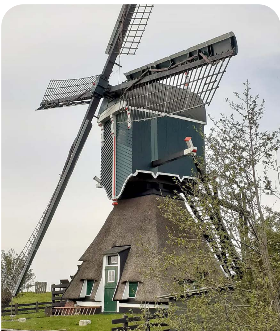
Dit is de Oukoope Molen in Reeuwijk. Het is een poldermolen.