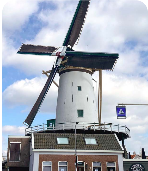
Dit is Molen de Arkduif in Bodegraven. Het is een korenmolen.